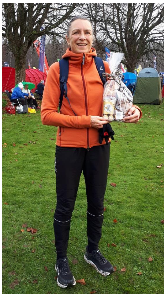
Extremt nöjd totalvinnare med pris i Borås!

Fick hämta ut mitt pris i förväg för att hinna promenera tillbaks till hotellet för att hinna duscha och gå till tågstationen. Alltid roligt att springa i Borås!