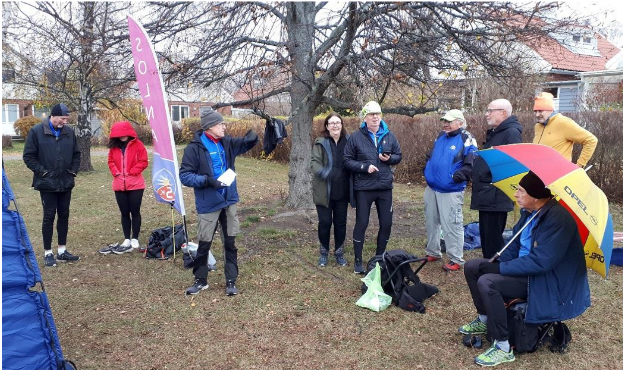
Några av deltagarna vid Barometersprinten i Fruängen