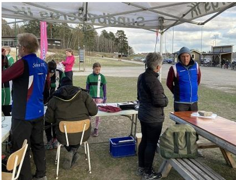
MOL i Ursvik