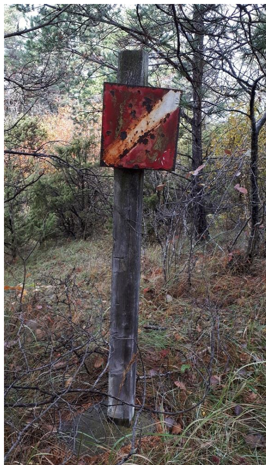
Denna gamla fina kontrollpunkt hittade vi utanför Visby