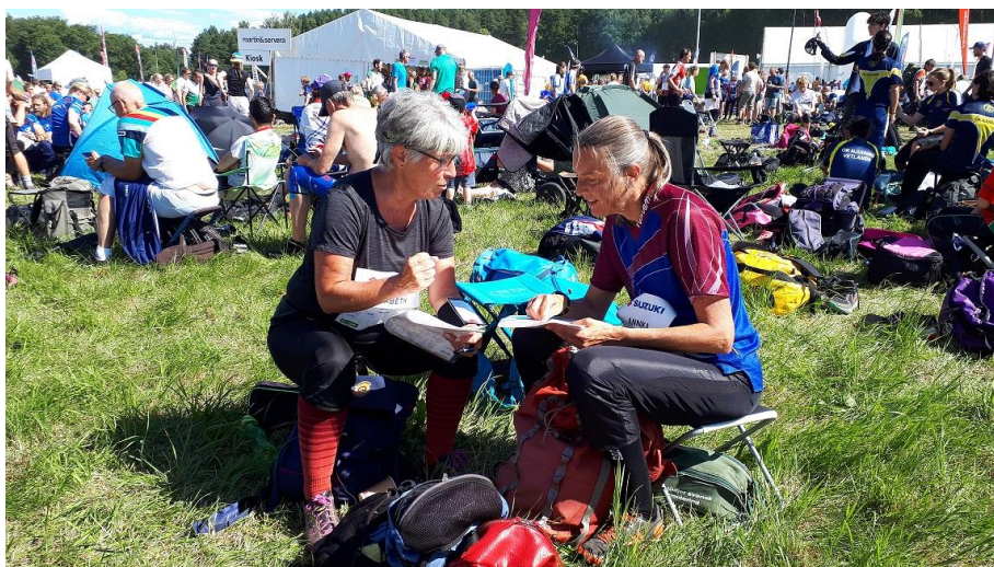
Vilket vägval gjorde du?