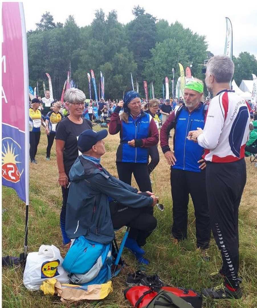
Samling vid arenan Pattons hage