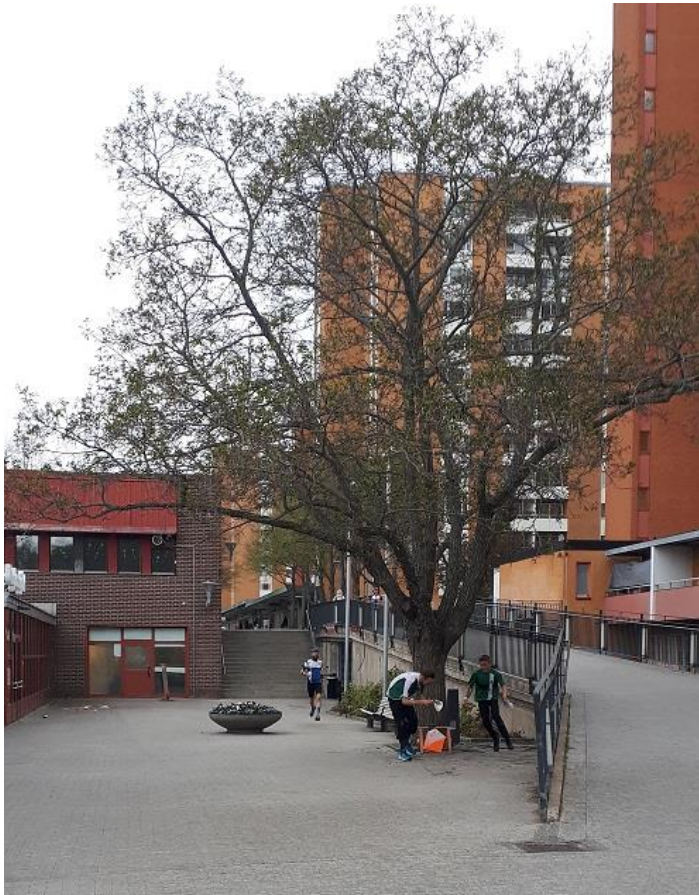
En av kontrollpunkterna i Akalla centrum

Vi tackade ja och beslutade att ha samma organisation som vår tävling 2021 beträffande tävlingsledare, banläggning, start, mål och sekretariat.