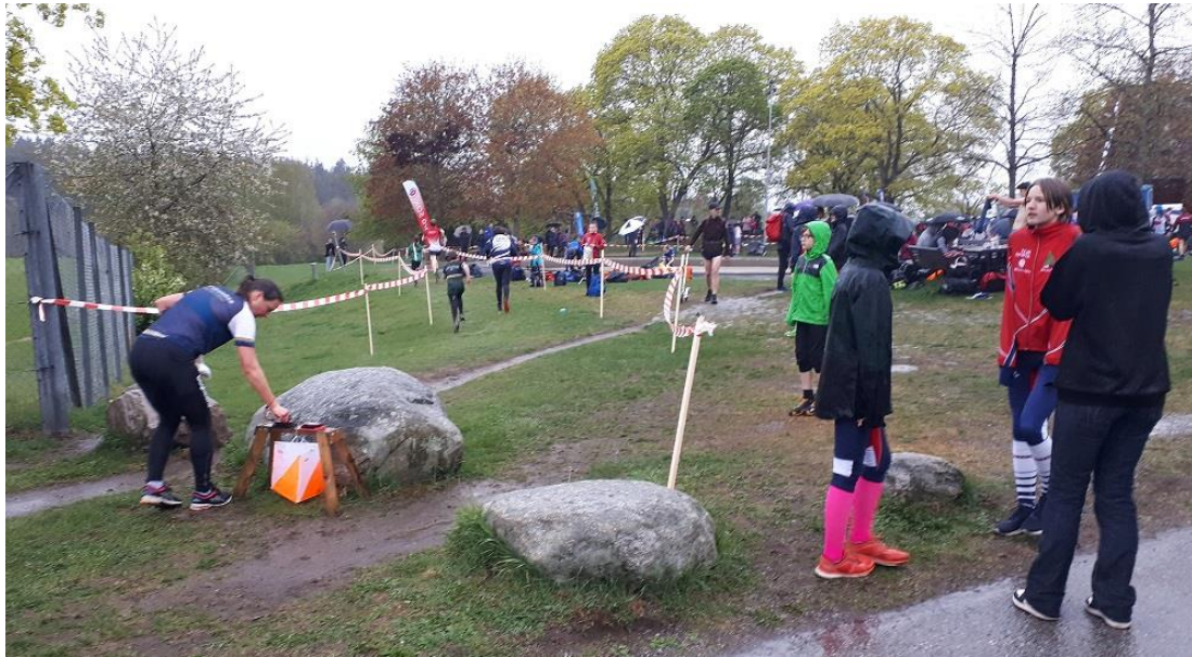
Sista kontrollen innan målgång vid Akalla by

Det började ösregna en bit in i tävlingen men alla var mycket positiva ändå. Kul att se alla funktionärer jobba på i regnet utan att gnälla. Tack till er alla. Också roligt att prata med boende i Husby som var mycket intresserade av vad som försiggick och hade många frågor om orientering.