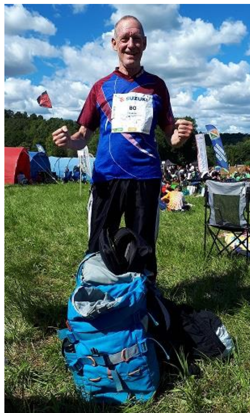
Bosse är superladdad!