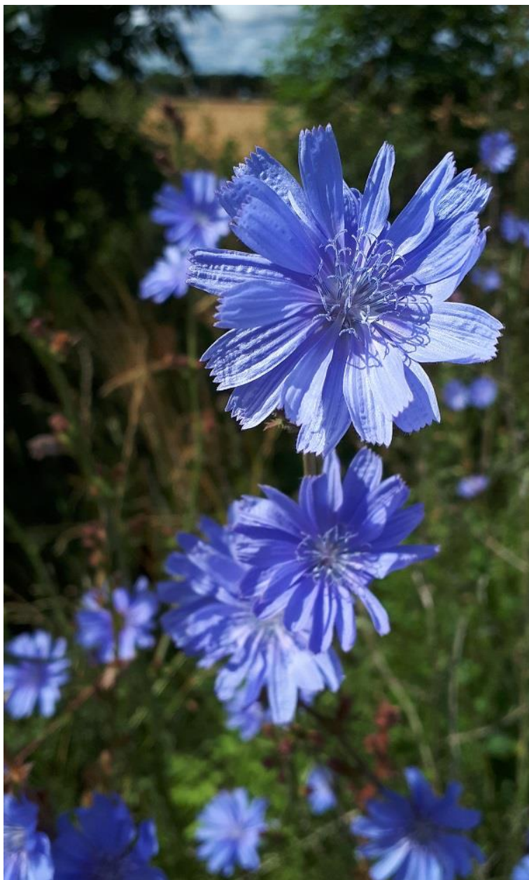
Cikorian blommar på Gotland!