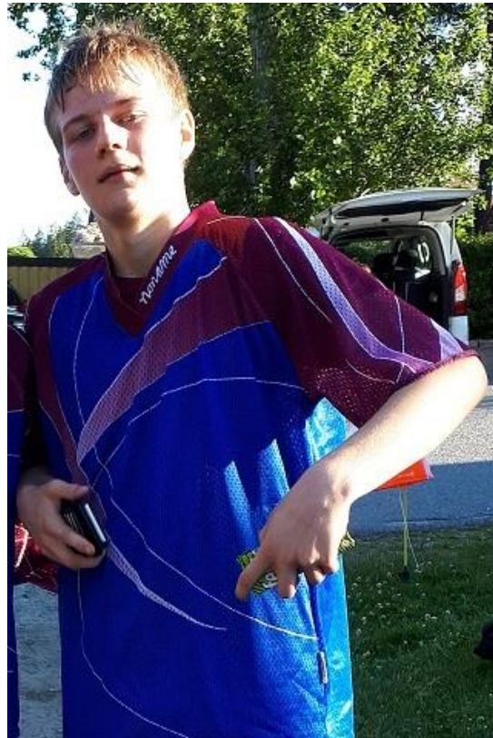
Årets vinnare Love

Under våren och hösten har vi haft regelbundna torsdagsträningar för våra ungdomar.