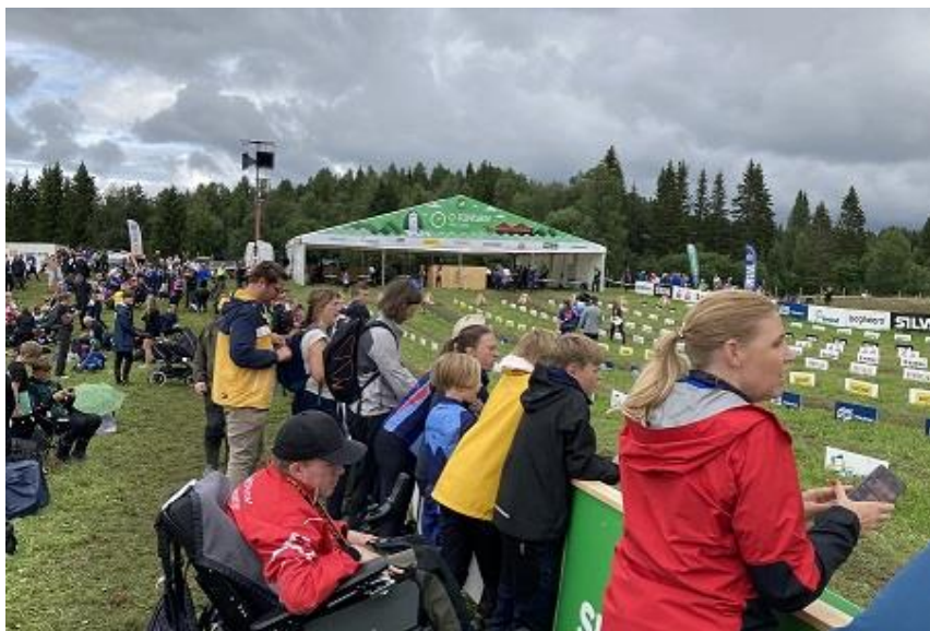
Målfällan vid Åre

förenklat på två saker: organisation och det tävlingsmässiga. Det sistnämnda betyget beror på kvalitén i fråga om kartor, banläggning och terräng. I detta avseende tycker jag att O-ringen Åre fick väl godkänt. Ett plus också för arenornas vackra inramning som vid Trillevallen de första två etapperna. Gångvägen från Trillevallen till startplatserna i solsken längs fjällsidan med milsvid utsikt över Åredalen måste tillhöra bland de naturskönaste miljöer som O-ringenlöpare fått uppleva. Denna etapp levde också upp till reklambudskapet om orientering delvis på kalfjället. Några kontroller högt upp på fjället Välliste (toppen är 1025 m ö h) fanns på den högsta höjdnivån någonsin i ett O-ringen. Eftersom övriga 4 etapper avgjordes i lägre terräng – visserligen gränsande till men ändå i skog och myrar nedanför trädgränsen – anser jag att arrangörens förhandssnack om att arrangemanget präglades av fjällorientering var en smula överdrivet.