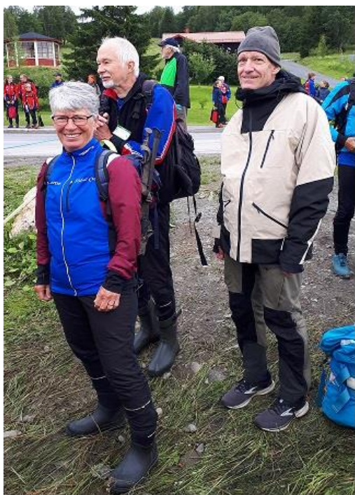
Vi väntar och väntar..