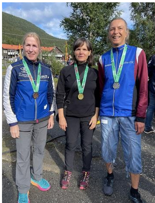
Medaljörerna i D60K