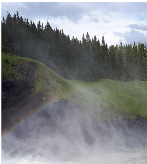
På vilodagen åker vi till Tännforsen

Hemvägen tog nästan lika lång tid p.g.a. att bussköerna från Trillevallen var minst lika långa som på vägen dit. En av orsakerna till kaoset var åtskilliga ändringar av transport och parkering i förhållande till det som presenterades i inbjudan. Ändringarna gällde de flesta områdena där deltagarna bodde såsom Åre by, Duved, Järpen m.m. Den röriga informationen ledde till ojämn belastning för många åkte till vissa påstigningsplatser som den i Undersåker medan andra busshållplatser hade för få resenärer.