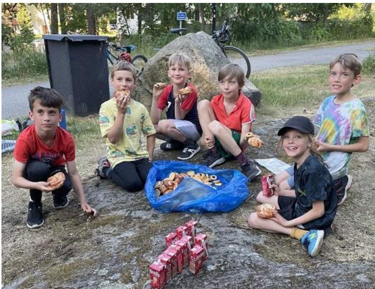
Under våren och hösten har vi haft regelbundna torsdagsträningar för våra ungdomar. Här är det fika efter sprint-KM och avslutning av vårsäsongen.