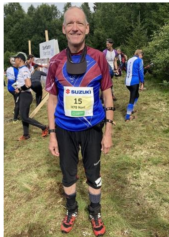
Bosse laddad inför jaktstart