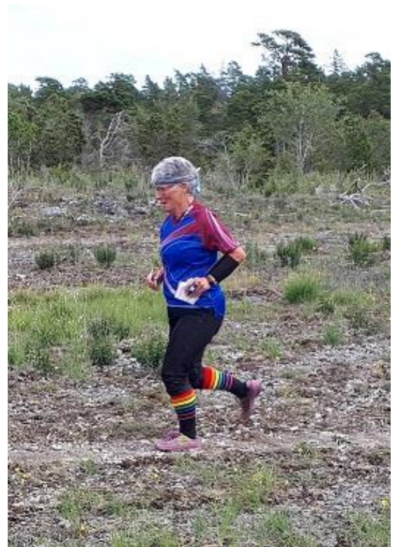
Elisabeth på upploppet