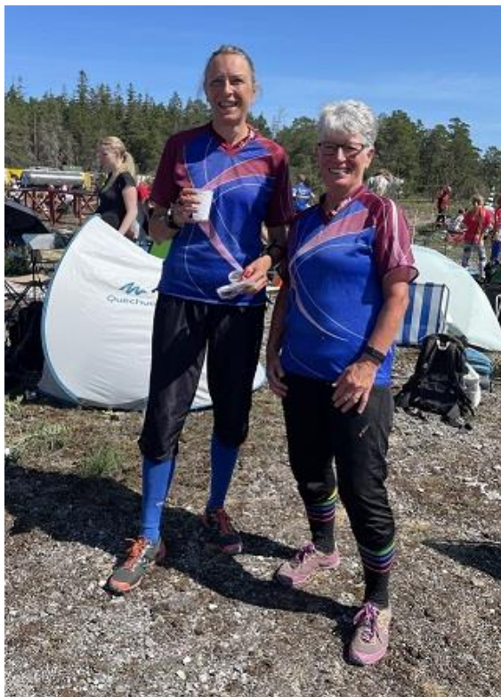
Solna OK på Gotlands 3-dagars